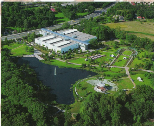
Blick auf das Rallyegelände